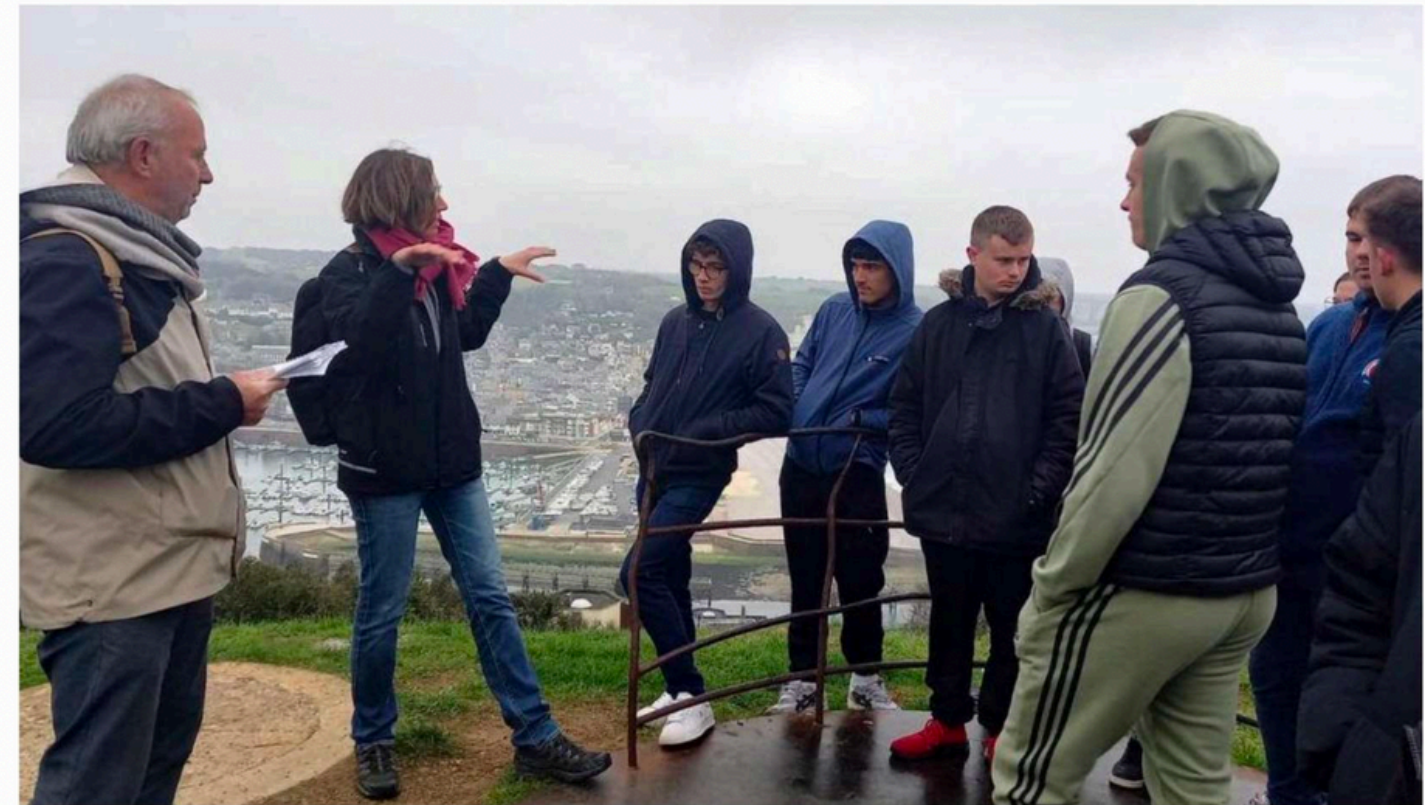
Le cap Fagnet, le port, les falaises ne peuvent être que des sources d'inspiration pour les élèves du lycée maritime Anita-Conti Labo des histoires

Des élèves du lycée Anita-Conti imaginent le monde maritime de demain. Dans le cadre d'un projet national, les meilleurs récits deviendront des courts-métrages.