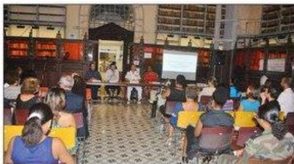
La Bibliothèque Schoelcher, le lieu idéal pour accueillir le Labo des histoires, dont l'inauguration officielle a eu lieu jeudi soir.

C'est au cœur de la Bibliothèque Schoelcher, symbole du savoir s'il en est, que le 4 e Labo des histoires, de France, a été inauguré officiellement, jeudi soir. Premier du genre en outre-mer , il réunit plusieurs partenaires de la culture et de l'éducation.